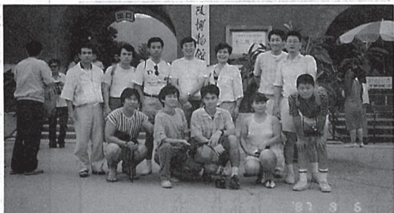
北京にて十三陵 全員で

又、旅行中いろいろとお世話 になった友誼旅行社の皆さんに も紙上をお借りしましてお礼を 申し上げます。